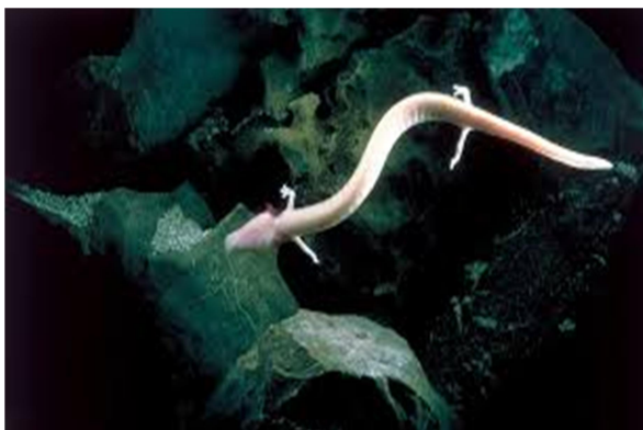
Slika 6-človeška ribica