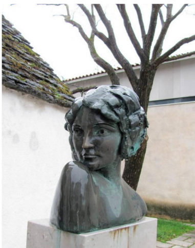
Slika 15- kip Ite Rine