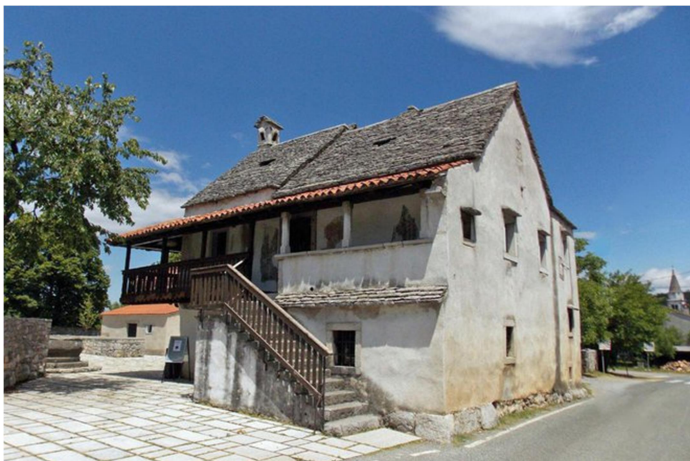
Slika 14-Škratlnova hiša

Druga stalna razstava pa je posvečeno slovenskim filmskim igralcem, ki se nahaja v nekdanji štali s senikom. Ob raznovrstnem muzejskem gradivu predstavi stvaritve domačih igralcev in igralk, razkrije proces nastajanja filmskih vlog in obiskovalce seznanja z igralci in igralkami, ki so se zapisali v zgodovino slovenskega filma.