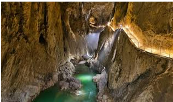
Slika 5-Škocjanske jame

Leta 1986 so bile jame uvrščene na Unescov seznam svetovne dediščine. V jamah živi tudi več vrst jamskih živali, med njimi najbolj znana je človeška ribica.