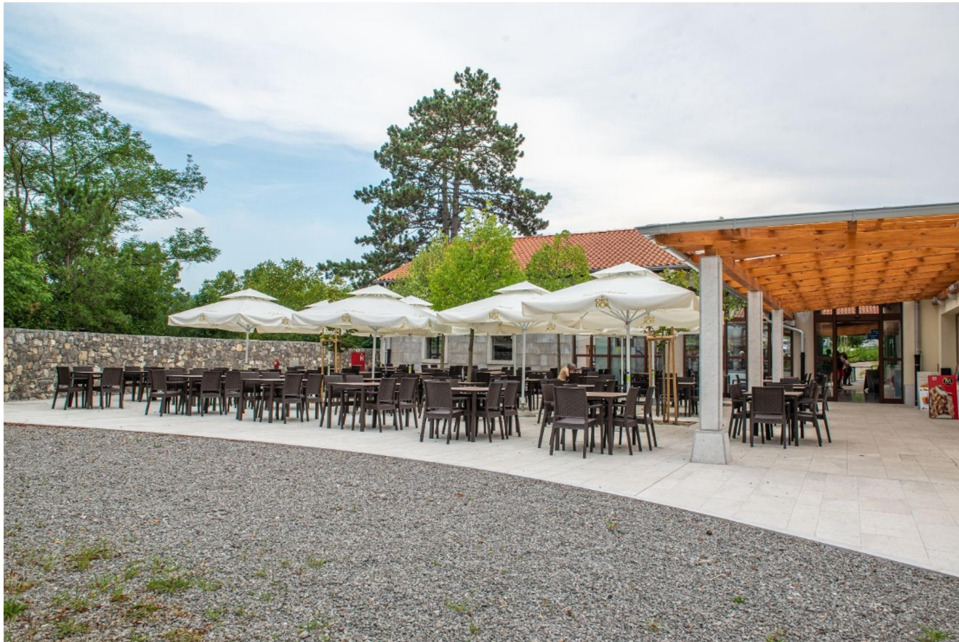
Slika 9-restavracija Ambrožič

V restavraciji Ambrožič, nas bo pričakal narezek. Narezek bo vseboval: kruh, olive, pršut, ki je zelo značilen za to območje, sir in pijača po izbiri.