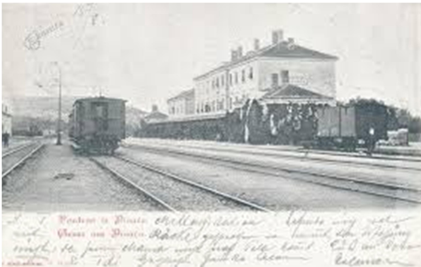
Slika 4-železniška postaja Divača

Železniška postaja Divača v starih časih.