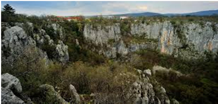
Slika 12-udornica Risnik

Ko prispemo v Divačo si bomo najprej ogledali udornico Risnik. Mogočna udornica Risnik je posebna kraška znamenitost, ki je nastala z vdrtjem stropa nekdanje jamske dvorane. Povprečen premer udornice je 220 metrov, njena povprečna globina pa meri 72 metrov. Okoli udornice je speljana zanimiva krasoslovna naravoslovna učna pot, po kateri se bomo sprehodili.