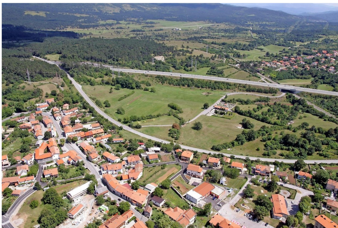
Slika 1-ptičja perspektiva Divače