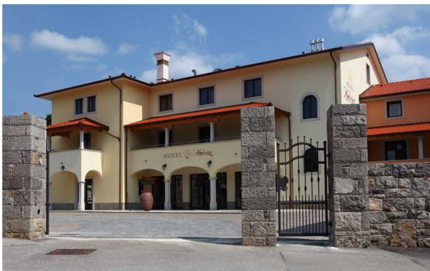
Slika 16-restavracija Malovec

Za večerjo bo na voljo juha (gobova ali goveja), fuži s tartufi, solata in sladica-zavitek (višnjev ali jabolčni).