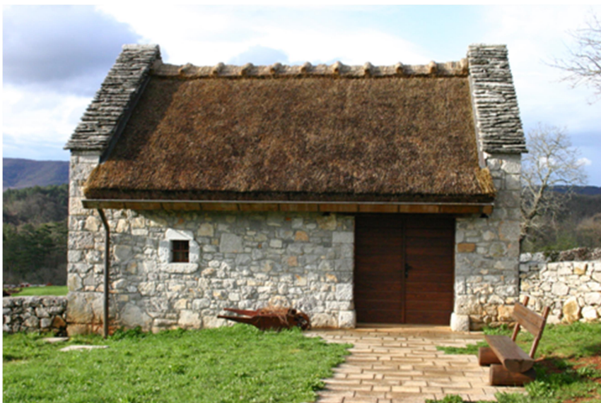
Slika 8-J'kopinov skedenj

V Delezovi domačiji se nahaja tretji muzej v katerem so postavljene tri zanimive zbirke. Geološka zbirka predstavlja zbrane kamnine matičnega Krasa. V arheološki zbirki izstopa nekaj duplikatov najdb iz Mušje jame pri Škocjanu. Ob ogledu biološke zbirke pa bomo spoznali, kako biološko pester je Kras.