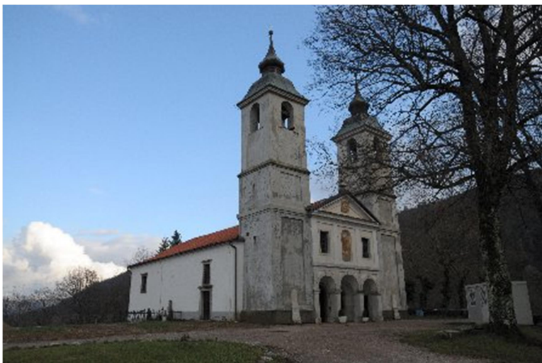
Slika 11-župnijska cerkev Marijinega vnebovzetja

Cerkev se nahaja v Vremski dolini in je ena najstarejših cerkva na območju Vremščice. Prvotna cerkev je bila zgrajena že v srednjem veku, skozi stoletja pa so jo večkrat prenovili. Današnja podoba cerkve ima značilnosti baročnega sloga, ki se odraža predvsem v zunanosti in notranji opreми. Osrednji del cerkve krasi glavni oltar z Marijinim kipom, ki je delo poznega gotskega sloga. Posebna dragocenost cerkve je freska Marijinega vnebovzetja iz leta 1854, ki jo je naslikal Domenico Fabbri iz Osoppa.